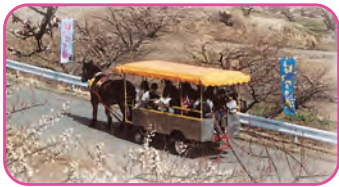
トテ馬車運行(梅林)

◎お祭当日は、JA西部営農センターが臨時駐車場となります。また、営農センターからエコール間で無料シャトルバスを運行します。