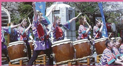
場所:慈眼院前駐車場

出演:2日(土) 上州吉井太鼓11:30~13:30~ 3日(日) 上州榛名太鼓10:30~13:00~