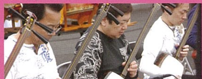
場所:慈眼院境内 時間:11:30~14:30~

日本の民謡を古典から現代風のアレンジ曲まで幅広く演奏する、音楽性豊かな人気のグループです。今年も春らしい楽曲を中心とした演奏を皆さまにお届けします。