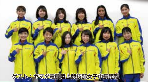
ゲスト：ヤマダ電機陸上競技部女子中長距離

●申込時の注意事項 表面の申込書に必要事項を記入の上、参加料を添えてお近くの郵便局にお申し込みください。払込み料金は窓口手数料200円・ATM手数料150円です。原則として申し込み受付後は、参加料はお返ししません。